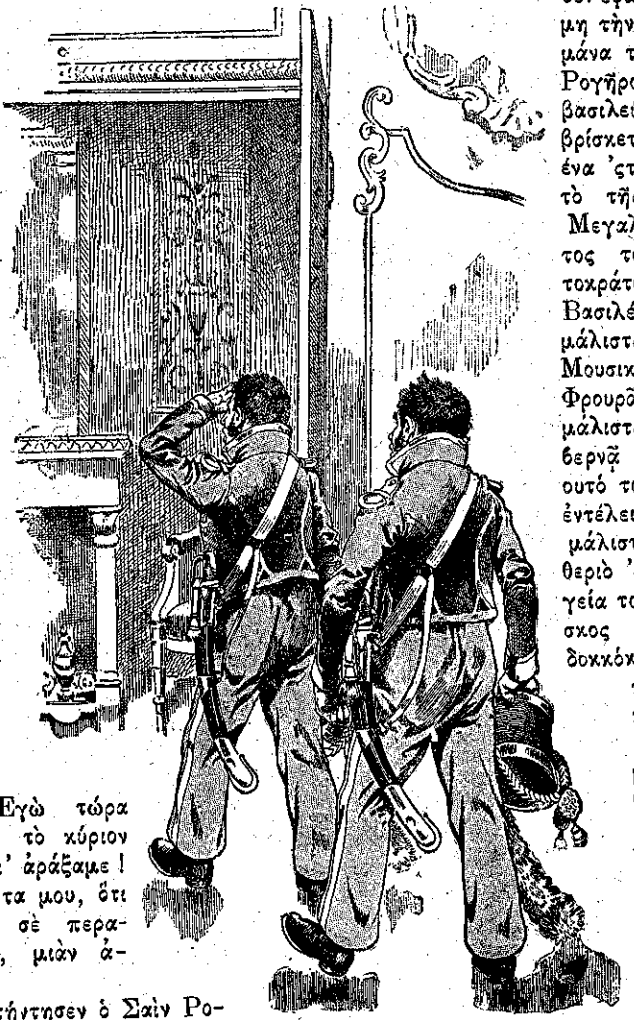
Καλημερούδια σας, κύριοι, κυρίες και όλη ή συντροφιά! (Σελ. 9, στ. α΄.)

Και ό Ίππότης, έσυρε από την τσέπην του λεπτόν μανδύλιον από βατίσταν και έσπόγγισε παχύ δάκρυ, ρέον κατά μήκος των κάπως άπεξηραμένων παρειών του. — Τότε φαίνεται, έξηκολούθησεν ό Παπαφίγκος, ότι τά νέα που σας φέρνω σας ενδιαφέρουν πολύ. Ο δούξ και ή δούκισσα Νοαρ. . . Σταθήτε μιά στιγμή μη να θυμηθώ τό όνομα. . . — Νοαρμών. — Μάλιστα, τό ήύρατε! Λοιπόν ό δούξ και ή δούκισσα Νοαρμών απέθαναν, καθώς ειπατε και του λόγου σας. Ο μουσικός των όμως, ό Ρογήρος, άδχι αυτός δέν έφαγε ακόμη την κουράμάνά του! Ο Ρογήρος ζή και βασιλεύει, και βρίσκεται όλοένα 'στο στρατό της Αυτού Μεγαλειότητος του Αυτοκράτορος και Βασιλέως, και μάλιστα 'στη Μουσική της Φρουράς, και μάλιστα κυβερνή το φλάουτό του 'στην έντέλεια, και μάλιστα εινε θεριό 'στην ύγεία του, φρέσκος και ροδοκκόκκινος, όπως εγώ και σεις, σεβαστέ μου αυθέντα! Άν έλάμβανε κανεις ύπ' όψιν του τό ήλιοκαές πρόσωπον του να ύτο υ και τάς ξηράς και ρυτιδωμένας παρειάς του ίππότου, θα εύρισκε βέβαια τό εγκώμιον πολύ ισχνόν. Άλλ' ό αγαθός Σαιν Ροκαντέν δέν έκαμε παρομοίαν σκέψιν, και άνέκραξε: — Πέ μου λοιπόν που εινε, που εινε ό Ρογήρος μου, τό παιδί μου — διότι τώρα εινε παιδί μου, — θέλω να τον ιδώ άμέσως. — Ίσα-ίσα γι' αυτό κ' έμεις άγκυροβολήσαμε 'στα νερά σας, σεβαστέ